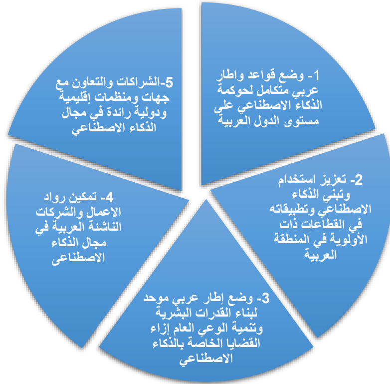
شكل رقم (5): محاور مجالات التعاون العربية المشتركة للذكاء الاصطناعي