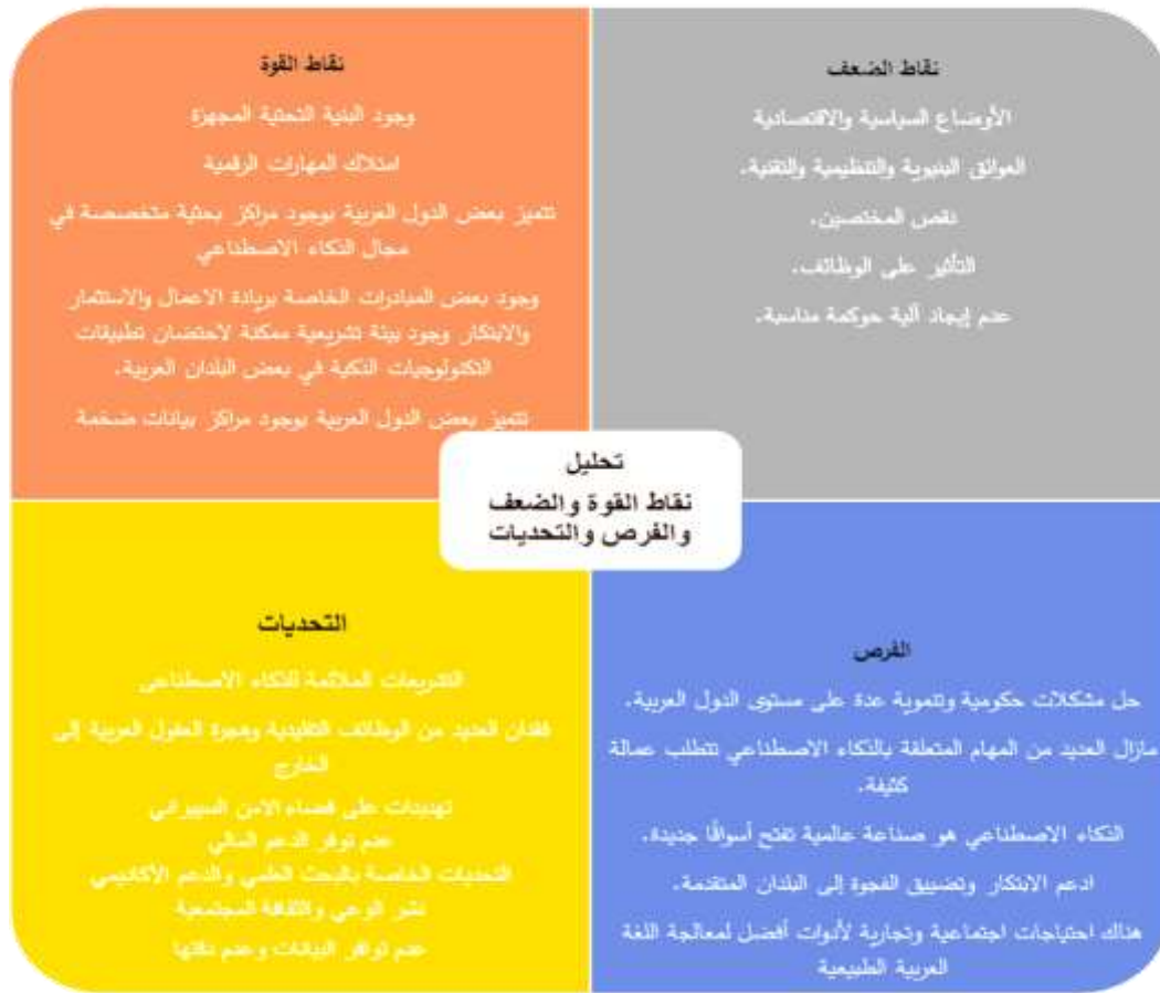
شكل رقم (3): تحليل نقاط القوة والضعف والفرص والتحديات للدول العربية

بالإضافة إلى التحليل السابق، سيتم الاعتماد أيضاً على تحليل PESTEL، وسيتم دمج النقاط المشتقة من تحليل PESTEL في مع تحليل SWOT للتعرف على وضع الذكاء الاصطناعي بشكل ادق في الدول العربية تمهيداً لعمل كامل يدعم إعداد وتنفيذ الاستراتيجية العربية الموحدة. تحليل PESTEL هو إطار عمل استراتيجي يستخدم لتقييم البيئة الخارجية للأعمال التجارية من خلال تقسيم الفرص والمخاطر إلى: