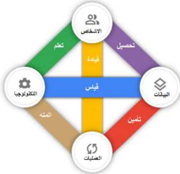
شكل رقم (7): عوامل بناء القدرات البشرية في مجال الذكاء الاصطناعي

يعتمد بناء القدرات البشرية في مجال الذكاء الاصطناعي على مجموعه من العوامل (الأفراد، البيانات، التكنولوجيا والعمليات) ويؤدي التفاعل بين هذه العوامل الأربعة الرئيسية الى ظهور ستة مواضيع: التعلم، القيادة، التحصيل، القياس، الأتمتة والتأمين. تعتبر هذه الموضوعات هي الموضوعات الأساسية لبناء القدرات البشرية في مجال الذكاء الاصطناعي.