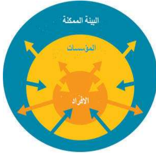
شكل رقم (6): إطار عام لبناء القدرات

https://www.fao.org/capacity-development/our-vision/en